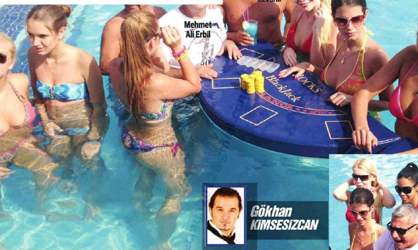
Mehmet Ali Erbil

Güzelli Miss Fa sunma giden M Erbil, g gündüz havuzd oyladı.