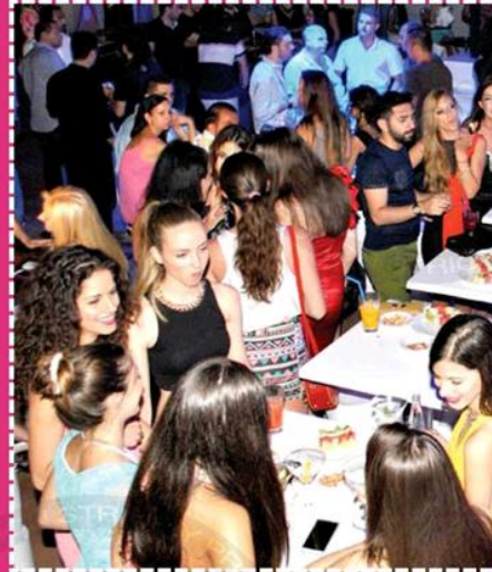
YARIŞMA ÖNCESİ EĞLENEREK MORAL Yarışması'na 29 farklı ülkeden katılan mankenler yarışma